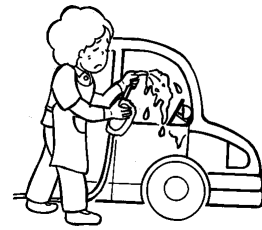
自家用車の洗車・清掃