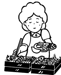
特別な手間をかけて行う 料理（おせち料理など）