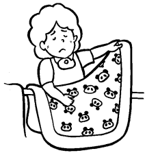
利用者本人以外の洗濯・調理