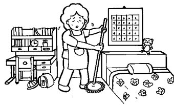
主として利用者が使用する 居室以外の掃除