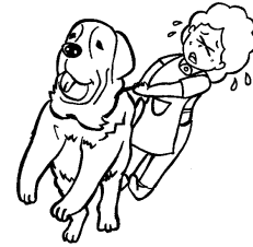
ペットの世話 (犬の散歩、ペット用品の 買い物代行など)