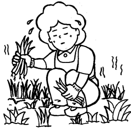
草むしり・草木の剪定