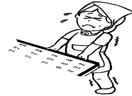
大掃除、窓のガラス磨き、 床のワックスがけ