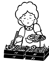
特別な手間をかけて行う 料理 (おせち料理など)