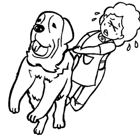
ペットの世話 (犬の散歩、ペット用品の 買い物代行など)