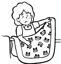
利用者本人以外の洗濯・調理