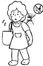
嗜好品 (アルコール、タバコ等) 本人以外の買い物代行