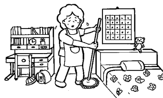
主として利用者が使用する 居室以外の掃除