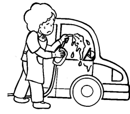
自家用車の洗車・清掃