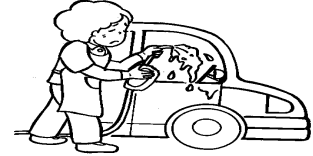
自家用車の洗車・清掃