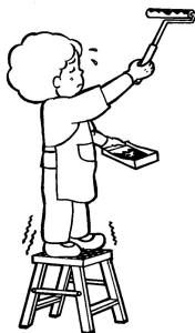
室内外家屋の修理、 ペンキ塗り