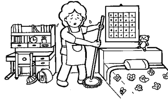
主として利用者が使用する