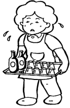
来客の応接 （お茶、食事の手配など）