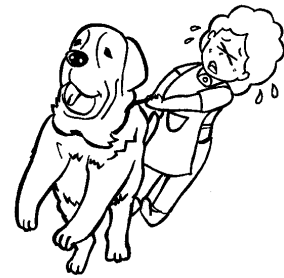
ペットの世話 （犬の散歩、ペット用品の 買い物代行など）