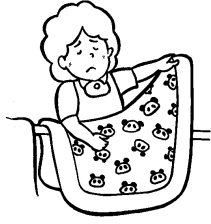
利用者本人以外の洗濯・調理