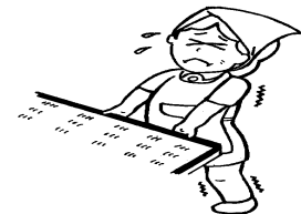
大掃除、窓のガラス磨き、 床のワックスがけ