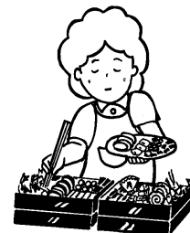
特別な手間をかけて行う 料理 (おせち料理など)