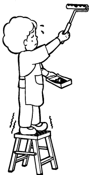
室内外家屋の修理、 ペンキ塗り